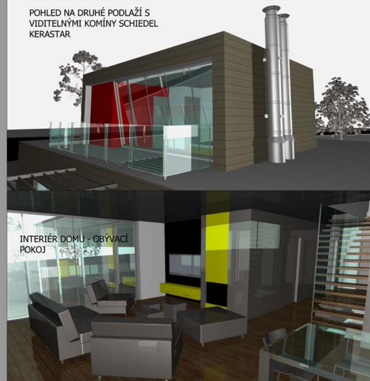
INTERIÉR DOMU - OBÝVACÍ POKOJ